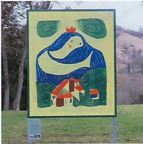
4 Berg (1937), 27,5 x 22,5 cm (aus Bilderbuch >Herzauges) – Eiferhöhe 2