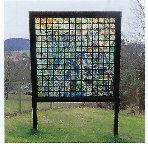
8 Poseidon und Amphitrite (1959), 4,5 x 4,5 m – Merat (unterhalb Griehaber-Anwesen)