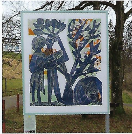
6 Das blaue Paar (1963), 76 x 65 cm – Grünanlage Winterhalde