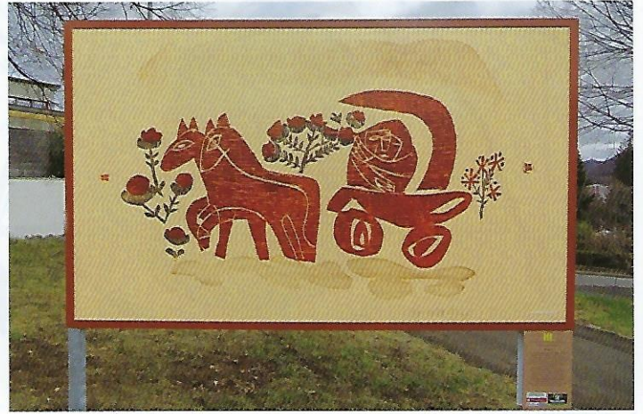
2 Wagen (1938), 25 x 37 cm – Schubertstraße/Betzenriedweg