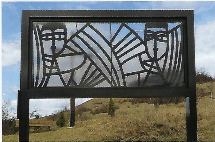
14 Posaunenblasende Engel (1956), 100 x 220 cm (Fenster aus dem 5-tlg. Engelfries in der St. Bonifatiuskirche Metzingen) – Kreuzbuckel