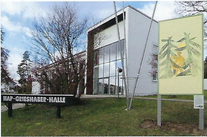
1 Pan (1939), 42 x 35 cm – HAP-Griehaber-Halle