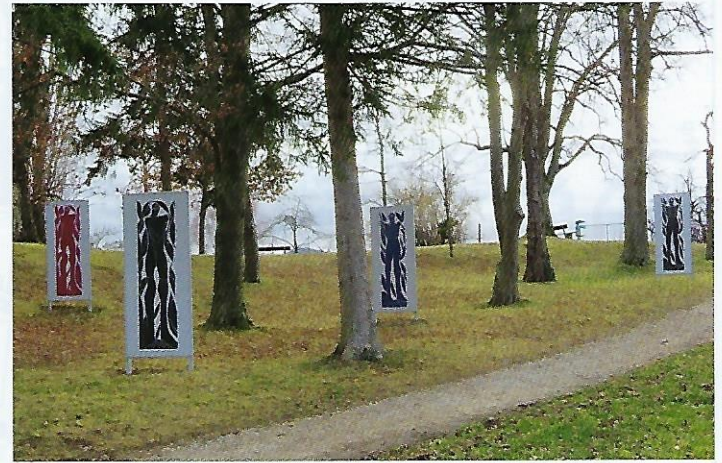
15 Epeheben (1967), 4 Repliken, je 216 x 58 cm – Schillerhöhe (Alle Maßangaben in der Ausführung von HAP Griehaber.)